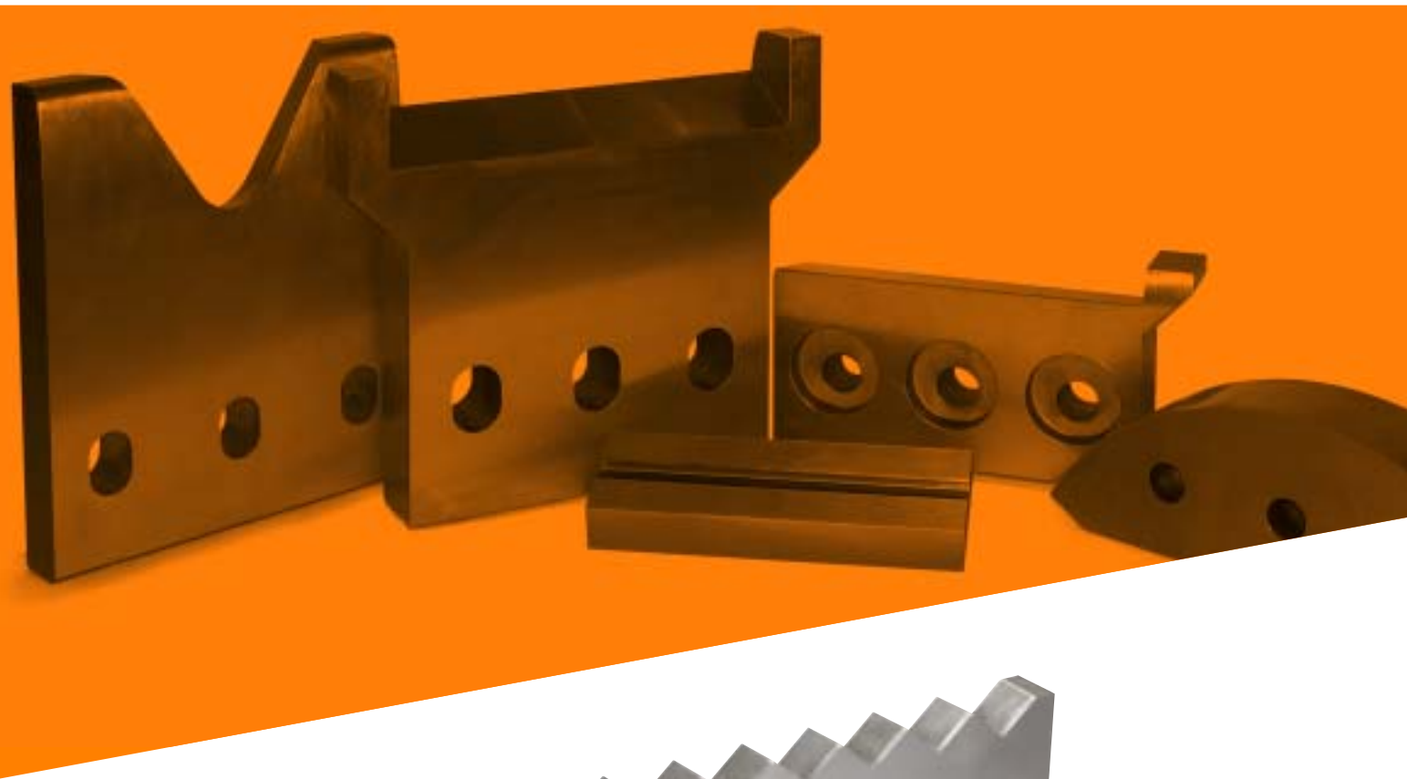
COLTELLI COLATA CONTINUA CONTINUOUS CASTING BLADES